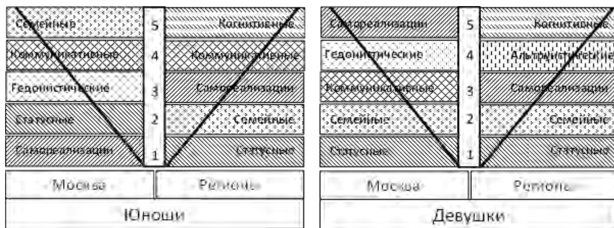
Рисунок 1а, б. Состав ценностного ядра подростков-мальчиков и девочек 17-ти лет в зависимости от места проживания.

Установлено, что ядро системы жизненных смыслов (пять ведущих смыслов) имеет различия в зависимости от региона проживания и гендерной принадлежности подростков. Пять ведущих смыслов 17-летних подростков-мальчиков, проживающих в Москве, составляют смыслы самореализации, статусные, гедонистические, коммуникативные и семейные; а у подростков-мальчиков, проживающих в провинции, эта пятерка состоит из смыслов статусных, семейных, самореализации, коммуникативных и когнитивных (рисунок 1а).